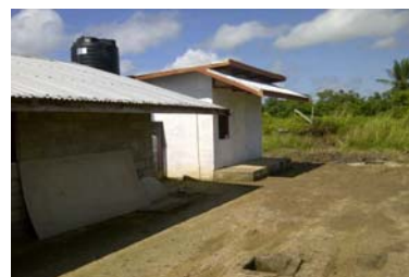
Het eigen slachtlokaal in aanbouw.