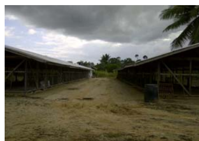
De gerenoveerde hokken.