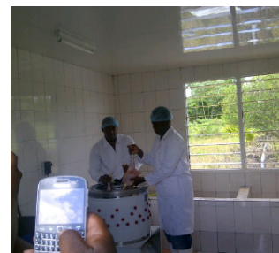
Proefdraaien met de plukmachine.