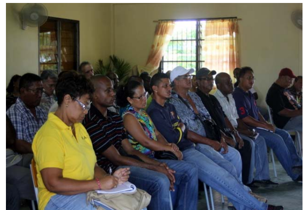
6 DNA lid Panka en de Bestuursleden van de APSS.